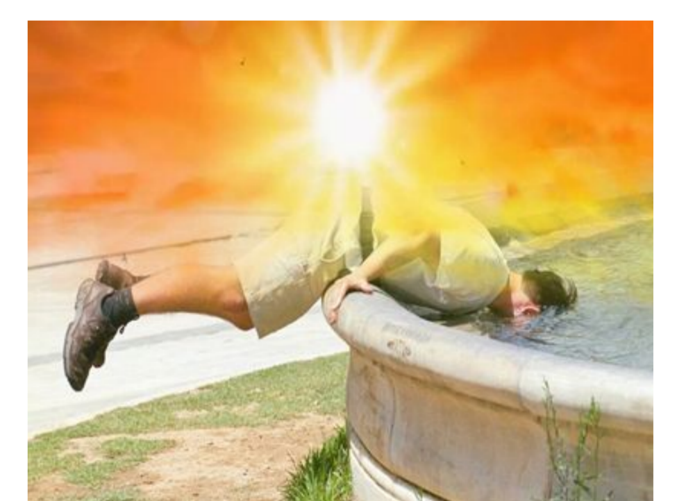
Ρεκόρ κατέγραψε ο καύσινας στη Γαλλία την Πέμπτη 28/8, καθώς το θερμομέτρο άγγιξε και τους 49 βαθμούς.