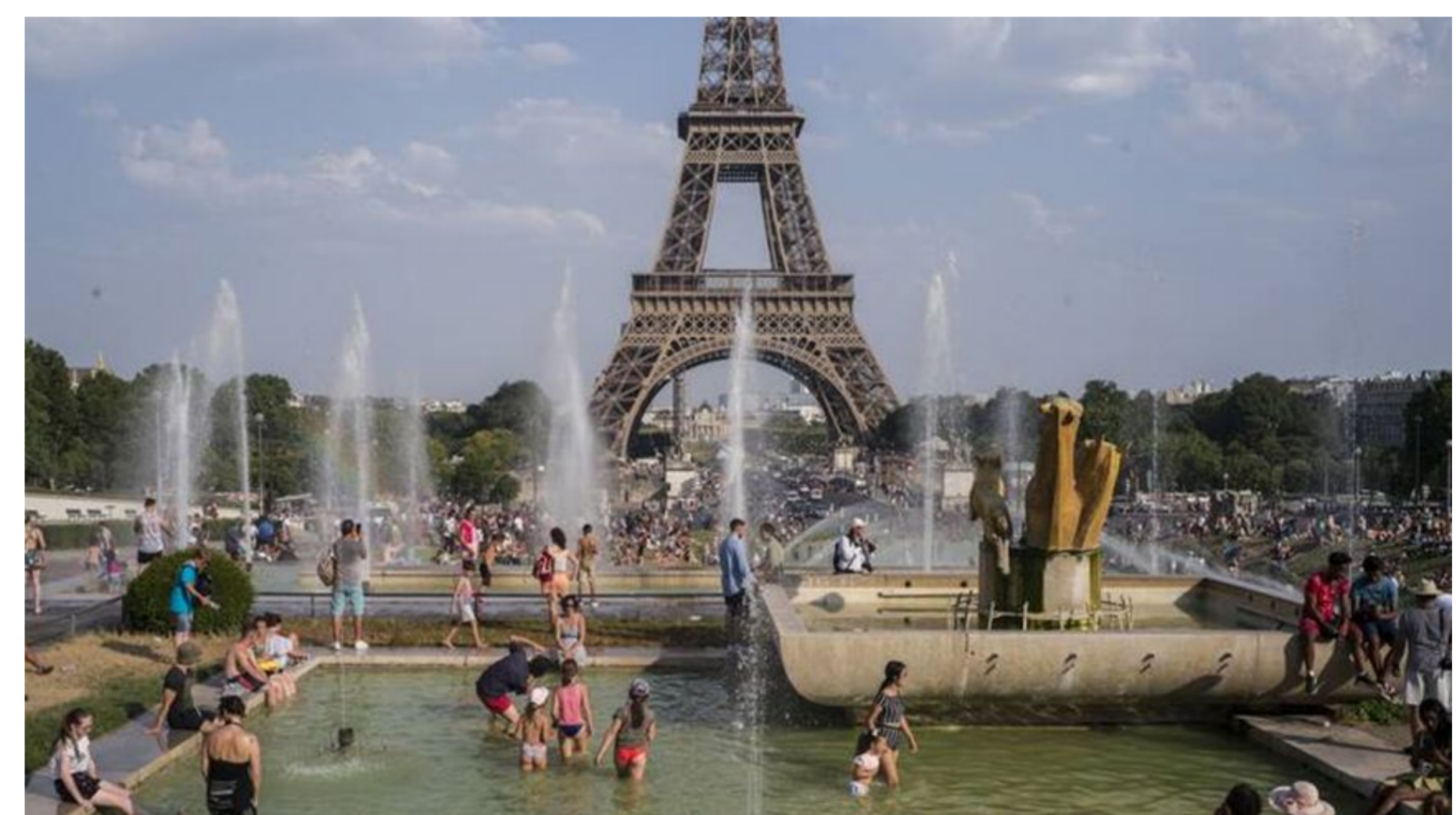
Στο έλεος των υψηλών θερμοκρασιών και το Παρίσι με τους τουρίστες να αναζητούν καταφύγιο στα πάρκα γύρω από τον πύργο του Άιφελ.